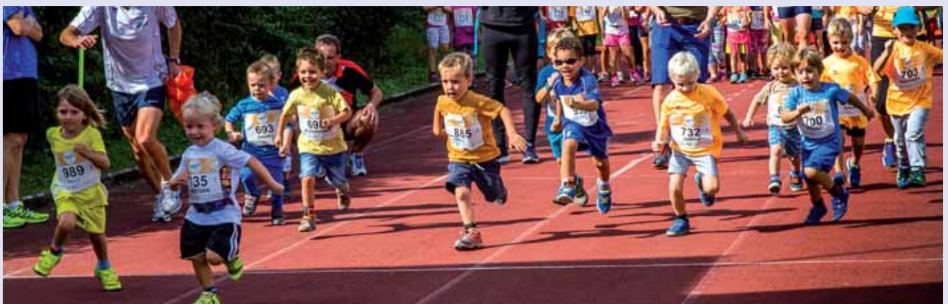
Die Begeisterung der Teilnehmerinnen und Teilnehmer beim Kindermarathon könnte auch Vorbild für die Vereinskultur der Erwachsenen sein.