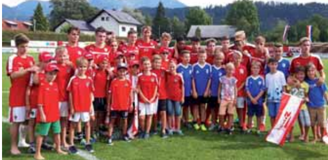
Besuch in Windischgarsten