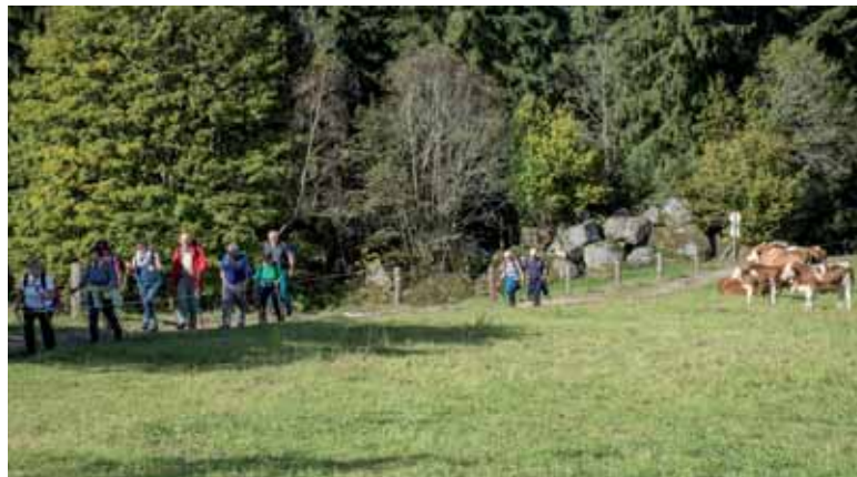
Herbstwanderung in Königswiesen

Nach dem ausgiebigen Mittagsmahl führte der 2. Teilabschnitt des Rundwanderweges zuerst immer leicht bergab entlang des Schwarzaubaches. Kurz vor Königswiesen gab es noch einen kurzen steileren Anstieg. Nach 1 ½ Stunden Gehzeit am Nachmittag wurde dann wieder der Ausgangspunkt, das Zentrum Königswiesen, erreicht, wo man noch beim dortigen Kirchenwirt im sonnigen Schanigarten am Marktplatz kurz einkehrte und dabei den herrlichen Herbstwandertag gemütlich ausklingen ließ.